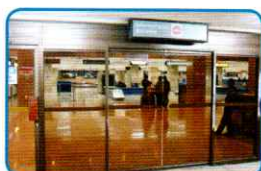
到着ロビーの出口ドアを出る。