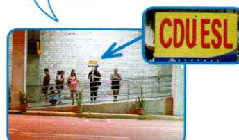
見つけた! 道路の向かい側に スタッフさん発見!