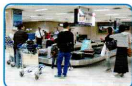
ちょっぴりドキドキした 入国審査を終えた後、 少し待って手荷物を受けて。

到着ロビーの出口は1つです。 出口ドアを出ると、道路を挟んで真正面に日本人の出迎えスタッフが待っています。