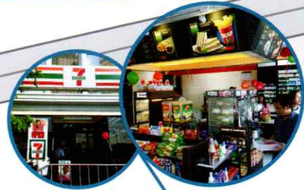
学校横のF・Eズエリク通り