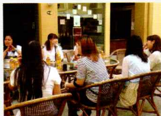
いつも賑わうオープンテラス席