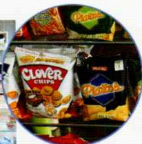
日本ではお目にかからないお菓子