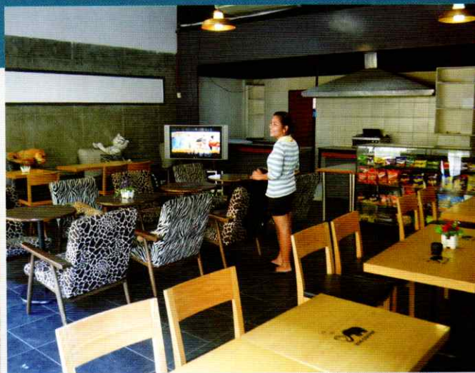
店内はみんなの憩いの場

フィールトクラウンジカフェテリアでは、スナック・ジュースなどを販売。友達と集まって雑談をしたり、勉強をしたりと、多くの学生が利用しています。23時までオープンしているのも、魅力的です。