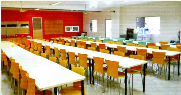
収容人数 200人の大きな食堂